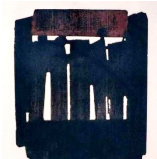
Soulages: eau forte n° 25. 1976.