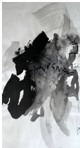
Alain Grosajt: Shungwa. 1988. 76 cm x 56