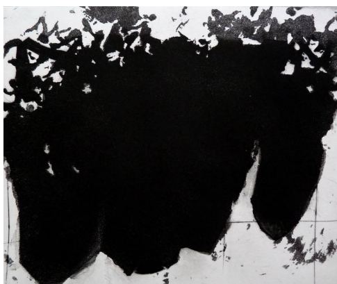
Daniel Lacomme: Géographique (gravure). 50 cm x 40

A côté, quelques œuvres de Daniel Lacomme, dont une encre de Chine frémissante.