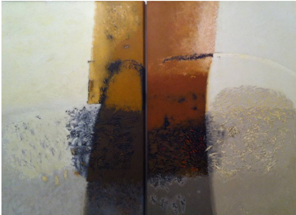
Giambattista Brisciani: Diptyque. 2010. 1,95 x 1,30 x 2.

En face un très grand tableau, un diptyque de l'artiste italien, Giambattista Brisciani.