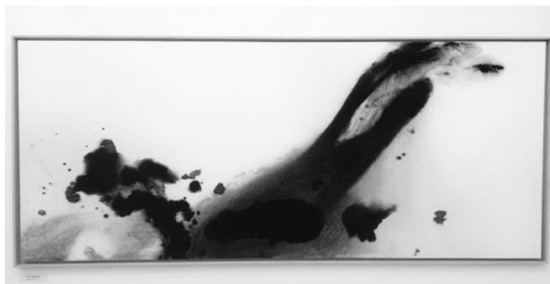
Serge Saunière: Sand titre. 2007.

Au fond, les encres de Chine de Serge Saunière : expressives et construites, en voici un exemple.