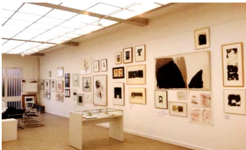
Centre Albert Chanot à Clamart: Grande salle (collection Gautier).

Le Centre d'arts plastiques Albert Chanot à Clamart présente plus de 250 œuvres de différentes valeurs issues de la collection Gautier sous le titre : "Collectionner ? Nous ne l'avons pas fait exprès !". Une petite rue de Clamart, près de la voie ferrée dans un quartier rempli de maisons en meulière, c'est là que ce cache le Centre d'arts plastiques Albert Chanot, nom du peintre local qui habitait autrefois ici. Une petite allée avec au fond un édifice en verre qui sert de lieu d'exposition. C'est là qu'est présentée la collection Gautier : 250 œuvres, serrées les unes contre les autres du sol au plafond sur trois salles dont une très grande et lumineuse.