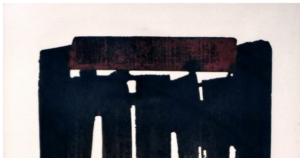
Soulages: eau forte n° 25. 1976 (détail)

En face, une eau forte de Soulages avec un effet de rouille très réussi.