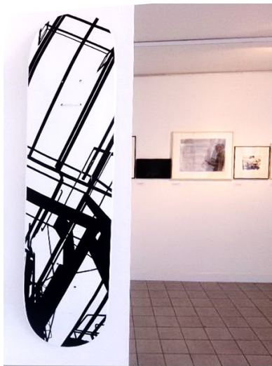
36 Recyclab: Skateboard Polyform-Zooml-Adhésif. 2006.

A côté, preuve de l'ouverture d'esprit du couple de collectionneurs, une semelle de skate d'un jeune artiste : 36Recyclab.